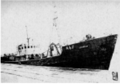
MV Ceder- lea in de haven