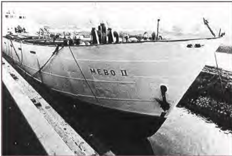
MEBO II in Slikkerveer

toegevoegd behalve dat men als een soort van Kerstcadeau twee weken lang verzoekplaten wilde gaan draaien voor de Europese jeugd, waarna pas de commerciële programma's zouden worden opgestart. Wettelijk hadden ze in Zwitserland geen problemen met hun nieuwe activiteiten, maar mocht dit in de toekomst wel het geval zijn, dan had men een uitwijkmogelijkheid in het Afrikaanse Sierra Leone. Een dag later meldde dezelfde krant dat de directie van Radio Veronica niet geschokt was door de komst van RNI. Het commentaar van Bull Verwey destijds: 'We hebben een vrije zee en Radio Veronica heeft niet het alleenvertoningsrecht op die zee.'