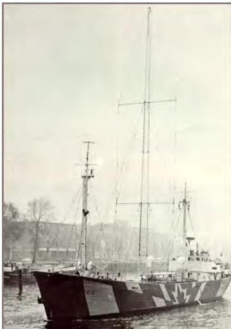
MEBO II verlaat haven van Rotterdam

waren uiteraard niet aanwezig om problemen te voorkomen, terwijl ook niet alle zenders aan waren boord. Een deel werd op 25 januari met de MEBO I langzij het zendschip gebracht. Verpakt in kisten werd het een hele klus om deze aan boord van de MEBO II te krijgen. Ook diende die dag een 25 ton zware ankerketting overgeheveld te worden. Dezelfde dag nog werd de eerste testtoon uitgezonden via de 6210 kHz en kon, niet veel later, een aanvang worden gemaakt met de gepresenteerde testprogramma's. Radio Nordsee International was daarmee een feit.