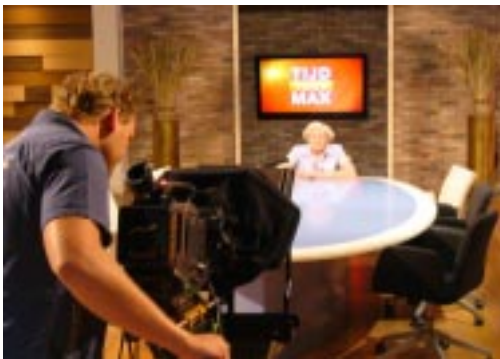
De studio van Tijd voor MAX

WO 19 AUG: De redactie van het Broadcast magazine meldt dat de leiding van de omroep MAX zich voorbereidt op een uitbreiding van zendtijd per 1 september 2010. Het budget stijgt bij uitbreiding van 8 naar 24 miljoen euro. Directeur Jan Slagter van Omroep Max: "Er komen nog drie adviezen aan naar aanleiding van ons beleidsplan, namelijk van het Commissariaat voor de Media, de Raad voor Cultuur en de NPO. Maar de minister heeft aangegeven dat hij het advies van de visitatiecommissie zwaar meeweegt bij zijn beslissing. Dus we bereiden ons wel voor op de definitieve erkenning. Intussen ziet men zich bij Omroep MAX geconfronteerd met financiële problemen. De nieuwe programma's moeten ontwikkeld worden en dat kost veel geld.