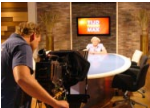
De studio van Tijd voor MAX