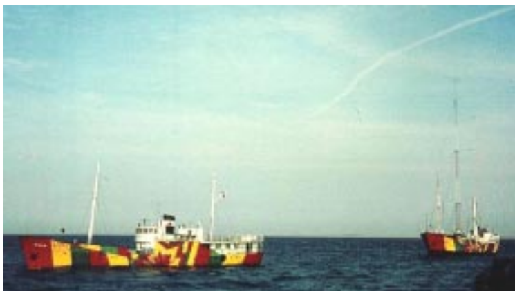
MEO I (links) en de MEO II op volle zee