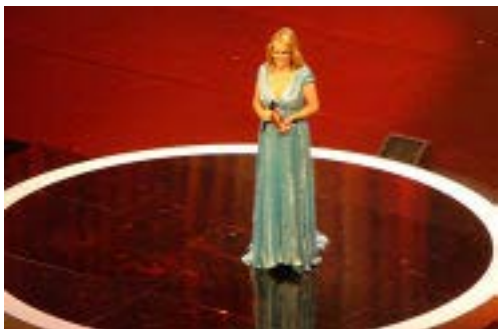
Chantal Janzen presenteert Televisiering Gala

DI 25 AUG: Chantal Janzen mag opnieuw het Televisier Gala presenteren. Daar wordt ieder jaar de belangrijkste publieksprijs voor de Nederlandse televisie uitgereikt, de Televisiering. Vorig jaar moest Chantal Janzen invallen voor Frits Sissing die de presentatie voorbij moest laten gaan omdat hij zelf genomineerd was voor een van de televisieprijsen. Het Televisier Gala is vrijdag 23 oktober te zien op Nederland 1.