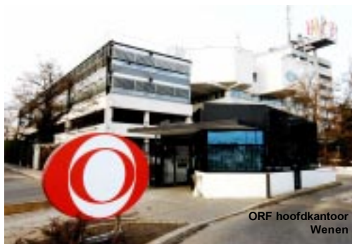
ORF hoofdkantoor Wenen

Hiermee gaat de oppermachtige ORF nog meer in het vaarwater van de commerciële stations zitten. Voor veel regionale radio- en televisiestations is regionale reclame momenteel de belangrijkste bron van inkomsten omdat de meeste landelijke adverteerders voor de ORF kiezen. Om een indruk te geven hoe oppermachtig de ORF momenteel is; met twee televisiekanalen scoort de omroep een marktaandeel van 33%, terwijl de 14 commerciële televisiestations bij elkaar 38% halen. Op radiogebied is het verschil helemaal groot. De vier publieke radiostations scoren bij elkaar een marktaandeel van 70,4%, terwijl de vele commerciële stations bij elkaar genoeg moeten nemen met 25%. Om te protesteren tegen de plannen is een groot aantal commerciële radio- en televisiestations een gezamenlijke protestactie gestart. In plaats van meer geld en reclame willen zij dat de kerntaken van de ORF preciezer worden vastgelegd, een verbod op 'product placement', een vermin-